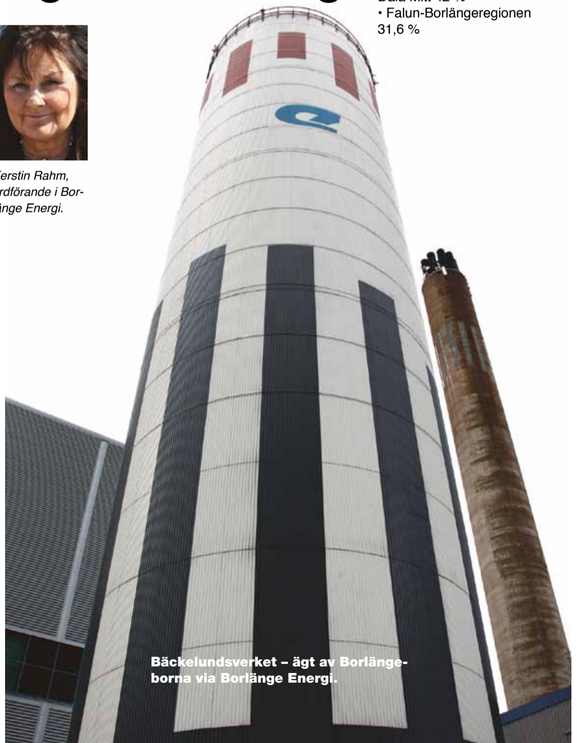
Bäckelundsverket – ägt av Borlängeborna via Borlänge Energi.