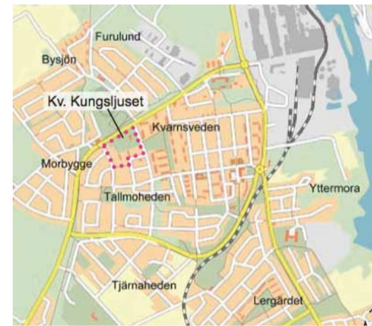
Kvarteret Kungsljuset i Kvarnsveden.