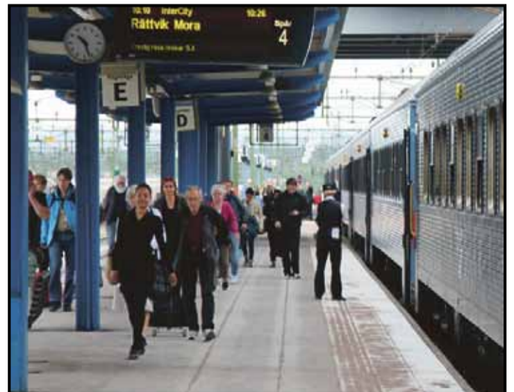
Stationen i Borlänge, ett nav för tågtrafiken i Dalarna.

VI KAN INTE VÄNTA med att skapa jobb och nya möjligheter