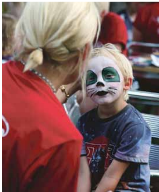
Barnomsorgen/skolbarnomsorgen, kostar 12, 23 kronor av en hundralapp.