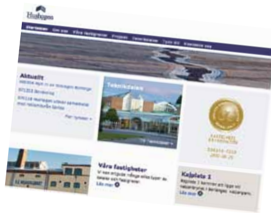
Fastighets AB Hushagen