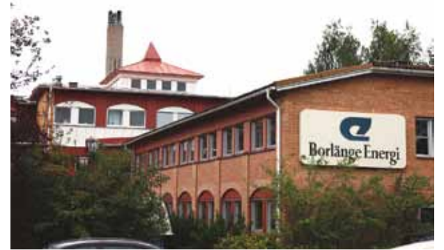
AB Borlänge Energi