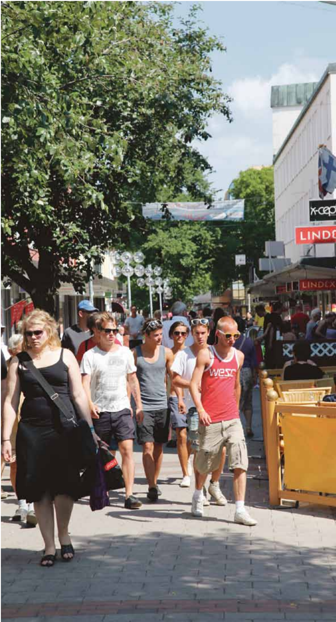
Ett sjudande Borlänge med många jobb. Det är Socialdemokraternas vision.