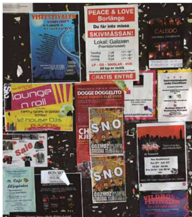
Borlänge ska ha ett rikt utbud av evenemang och aktiviteter.