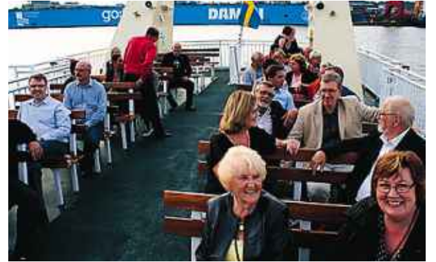
Båtresa med guidning kring Göteborgs hamninlopp.